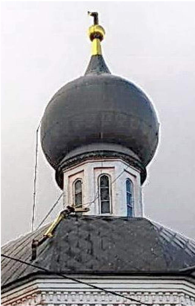
Снято 18.09. – после урагана